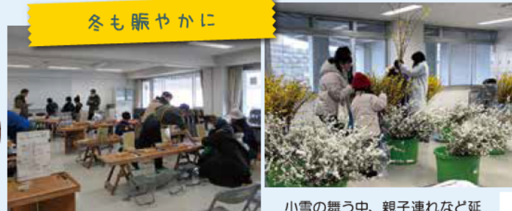
『遊んで学んでスカイパーク』 『早春のかぼり お届けします～花木無料配布』 2.23@サンプロアルウィン会議室ほか 小雪の舞う中、親子連れなど延 べ約1,500人が訪れ大盛況でした。