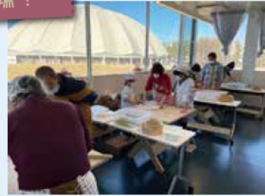
『信州スカイパークで 年越しそばを打とう』 2023.12.29,30@東管理棟会議室