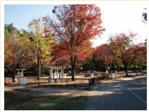
バーベキュービット付近 @ターミナルゾーン