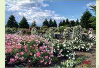
バラ園の見頃の ピークを迎えた6 月。こぼれるよう にたくさんの花が 咲き、訪れた人は その見事さに歓声 を上げていました。