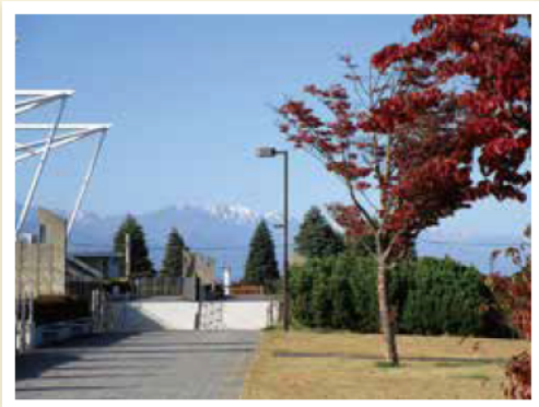
サンプロアルウィン付近 @みどりの交流ゾーン

2024年もご覧いただきありがとうございました。来年も信州スカイパークをどうぞよろしくお願いいたします。公式SNSもチェックしてね!