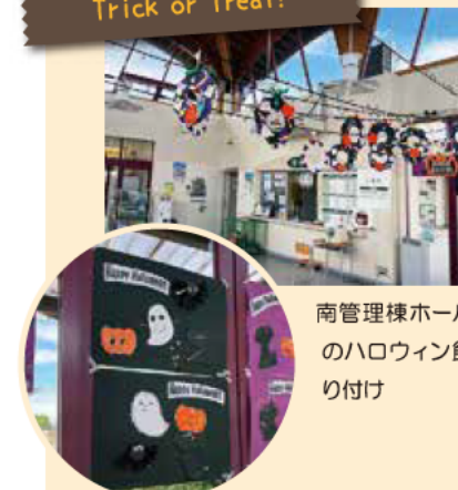
南管理棟ホール のハロウィン飾 り付け