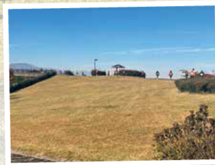
松本マラソン 2024 開催 11/100 街かど広場 (みどりの交流ゾーン)