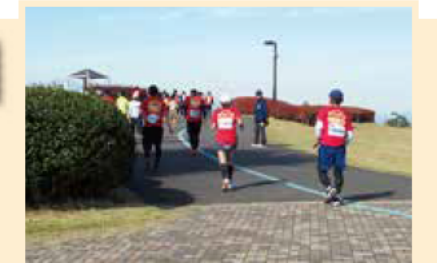
『松本マラソン 2024』 11.10@エア・ウォーターアリーナ松本 (松本市美須々)～やまびこドーム 秋晴れの空の下、約 5,000 人のランナー が松本市街地からやまびこドームまでの 42.195km を駆け抜けました。