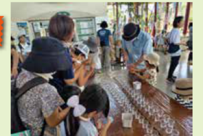
『七夕まつり』 7.28@南管理棟