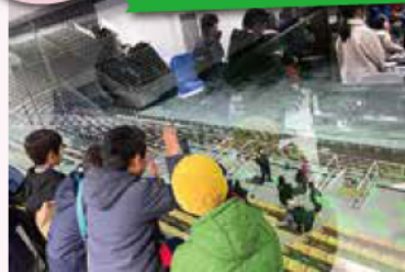
『けんせつ現場見学会 ～新しい光を体験しよう～』 3.2@サンプロアルウィン