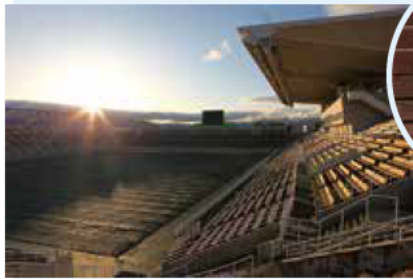
サンプロアルウィンから望む初日の出