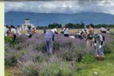
『ラベンダーフェスティバル 2024』 7.20@競技スポーツゾーン・ こども広場付近