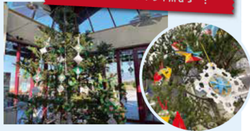
Merry Christmas! 南管理棟とやまびこドームに恒例 のクリスマスツリーが登場、近隣の保育園のこども 達お手製のオーナメントで華やかに飾り付けられま した。今年はどんな飾り付けになるか楽しみです!