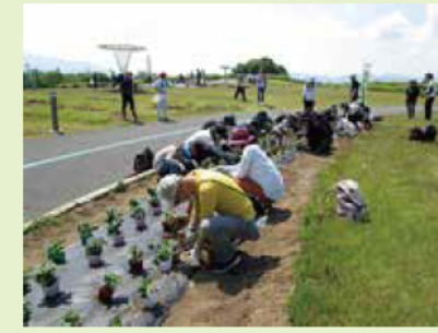
FM 長野エバグリーンキャンペーン 『サンパチェンスミーティング in 信州スカイパーク』 6.8@みどりの交流ゾーン