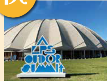
『ALPS OUTDOOR SUMMIT 2024』 10.5,6@ やまびこドームとその周辺