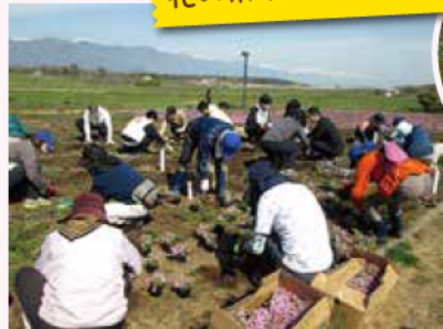
『花守りの会』① 年次総会・ シバザクラ植付け 4.13@野と花のゾーン