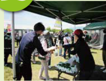
サンプロアルウィンの芝生無料配布 6.1@「2024 明治安田 J3 リーグ」 第15節 松本山雅 FC vs FC 今治戦にて