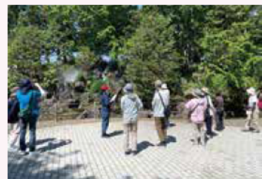
『スカイパーク四季めぐり 園内ガイドツアー〔春〕』 5.11@ターミナルゾーン