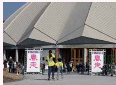
『春の松本ランニングフェスティバル 2024 in 信州スカイパーク』 3.16@やまびこドーム～信州スカイロード 10 恒例の“春ラン”開催。今年はお天気にも 恵まれ、約 1,500 人の参加者が早春のスカ イパークでランニングを楽しみました。