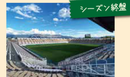
2024 明治安田 J3 リーグ第 37 節 松本山雅 FC vs FC 琉球 11.16@ サンプロアルウィン ホーム最終戦は 2-1 で勝利、本節終了時 時点で J2 昇格プレーオフ進出が決まりました。