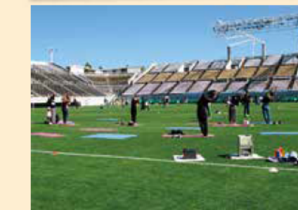
『サンプロアルウィンの芝生をはだして 走ろう! ～サンプロアルウィン無料開放～』 10.14@サンプロアルウィン