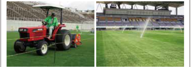
サンプロアルウィンで使用している 3 種類の寒地型西洋芝

具体的には芝生を均一の長さ刈り込む芝刈り、芝生に肥料を与える施肥、病害虫の発生を防ぐ薬剤散布、フィールドに細かい穴をあけて空気を入れ根腐れなどを予防するエアレーション、芝生の傷んだ部分を張り替える芝張り、競技に合わせて試合前にコートの白線を引くライン引きなどを行っています。芝生フィールドに水を撒く散水は、フィールドの地下に埋設したスプリンクラーを自動制御で行っています。