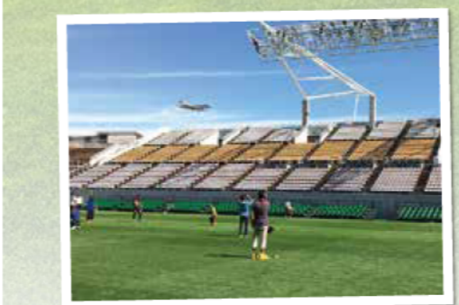
ピッチからFDA機の着陸を見守る(サンプロアルウィン無料開放イベントにて)

さて、新学期がスタートしました。小・中学校などではこれから運動会や遠足、社会見学といった学校行事が目白押しだと思います。信州スカイパークにも各学校などから大勢の子どもたちが訪れ賑わいます。サンプロアルウィンには以前、社会見学に訪れた皆様からよくいただく質問にお答えしたものをまとめた『アルウィンしつもんばこ』という資料がありました。今回は内容を最新にリニューアルした2024年度版として皆様にお届けします。