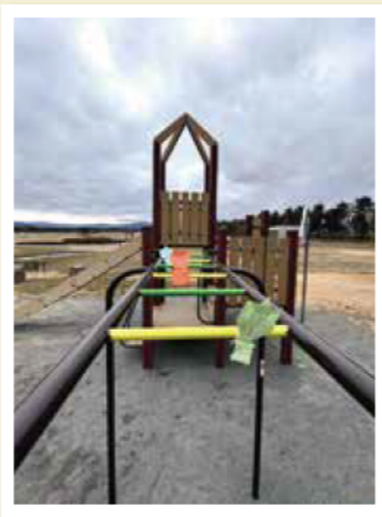
南管理棟周辺 (ファミリースポーツゾーン)

すべり台やアスレチック遊具など色々な遊具で楽しめます。 土・日・祝日はおもしろ自転車も絶賛営業中。