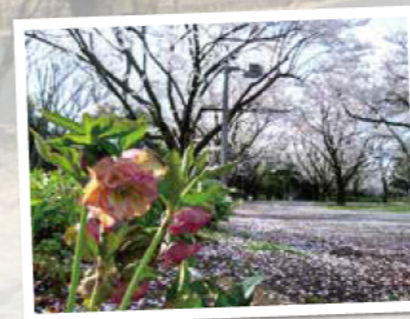
「桜とクリスマスローズ」 2023.4@花のプロムナードゾーン

今月はこれから春にかけて園内で見られる花をご紹介します。少しずつ暖かくなっていくこの時期、小さな春を探して早春のスカイパークを散策してみませんか?