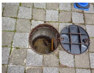
マンホールを開けて確認