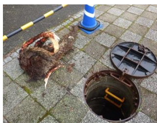
詰まっていた木の根を除去