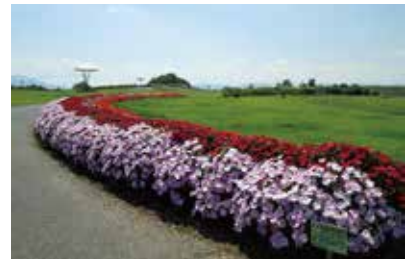
夏、見事に咲いたサンパチェンス (みどりの交流ゾーン) 2019.8月撮影