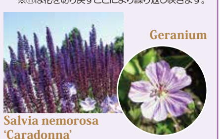
Salvia nemorosa 'Caradonna' Geranium