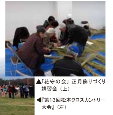
▲「花守の会」正月飾りづくり講習会 (上) ▲『第13回松本クロスカントリー大会』 (左)

暮れも押し迫る師走のスカイパークでスポーツやボランティアなどの催しが開催されました。 12月6日(日)、芝生の上のコースを走ってタイムを競う『第13回松本クロスカントリー大会』が【ファミリースポーツゾーン】などで行われました。昨年は積雪のため初の開催中止となりましたが、今回は天候にも恵まれ、選手の皆さんは白い息を吐きながら初冬のスカイパークを駆け抜けていました。また、12日(土)にはスカイパークの花のボランティア「花守の会」の活動をアルウィンの会議室で行いました。本年度最後の活動となる今回は恒例の正月飾りの講習会を開催。会員の方が講師となり、わらを編んで作る昔ながらの正月飾りを各自で作りました。