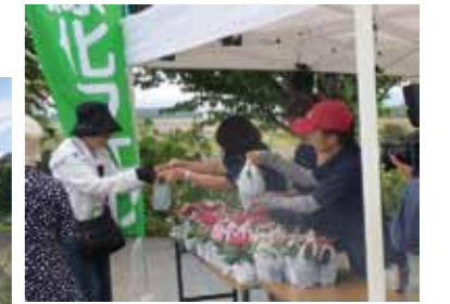
写真左: 8/2『ラベンダーフェスティバル』 写真右: 8/9『花と緑のフェスティバル』