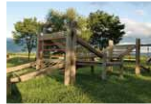
▲写真はイメージです