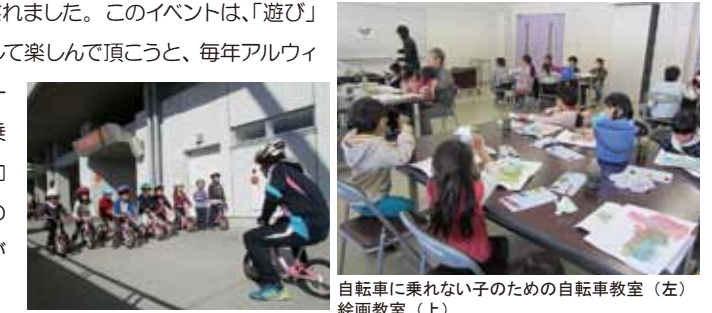
自転車に乗れない子のための自転車教室(左) 絵画教室(上)

2月23日(土)、アルウィンで『遊んで学んでスカイパーク』が開催されました。このイベントは、「遊び」と「学び」をテーマに、子どもから大人まで、また親子で気軽に参加して楽しんで頂こうと、毎年アルウィンで行われています。今年は、アルウィン内を見学するスタジアムツアーなど人気の企画の他、保育園～小学生向けの絵画教室や、自転車に乗れない子どもを対象にした自転車教室など新しい企画も登場し、参加者も昨年を上回る700名余りと大盛況でした。他にもショベルカーの試乗体験やスポーツ吹き矢教室など、普段はなかなかできない体験ができとあって、多くの家族連れで賑わっていました。