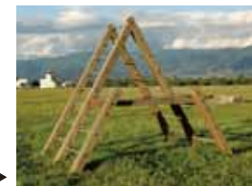
写真はイメージです▶

■【競技スポーツゾーン】健康の森の遊具を更新し、おもしろ自転車広場北側に移転します。こども広場の一部遊具も更新工事をを行います。