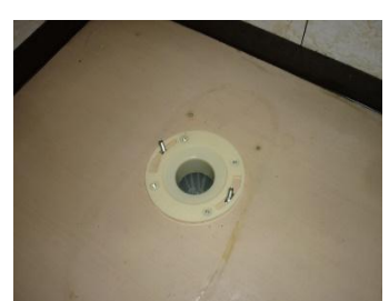
床フランジ取り付け