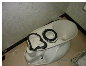
洋式便器パッキン交換