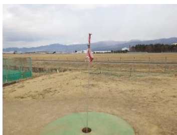
作業前(やまびこ 17番)

マレットゴルフ場 やまびこコース 16・17番、しらかばコース 15番のフラッグが破れていたのを、交換した。