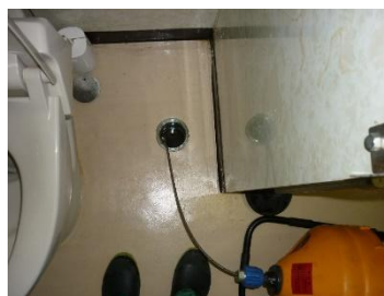
床上掃除口よりカンツール施工

体育センターの洋式トイレがつまり、排水困難になった。配管径が 75mmと細く、天井内の横引き配管が長いのがつまりの原因のひとつと考えられる。洋式便器を取り外し、つまっていた汚物を吸引、清掃、洗浄水を 15リットル以上流れるよう調整し再発防止をした。