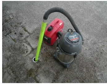
排水管つまり解消