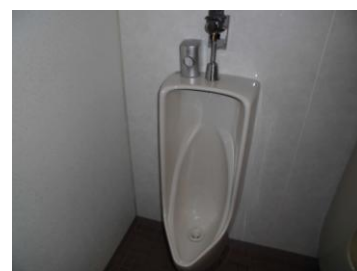
部品取替後動作確認