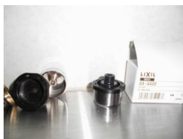
ボタンユニット取替え