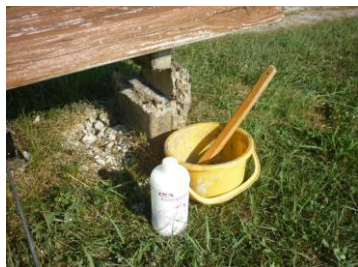
モルタル接着増強剤