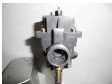
ボタンユニット取外し