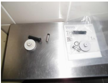
プランジャ部取替え