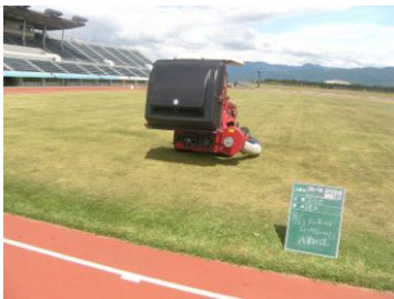
作業状況(陸上競技場)