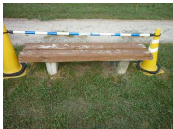
基礎部モルタル補修完了