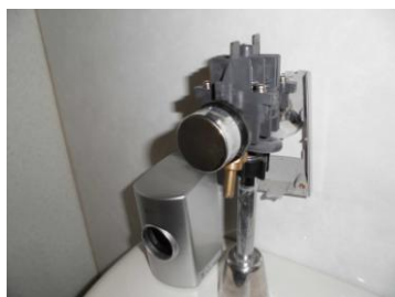
分解前(カバー取外し)

陸上競技場の男子トイレ 7 番の押しボタン式フラッシュバルブの水がたまに止まらなくなった。内部を分解清掃したが症状が変わらない為、ダイヤフラムユニットとボタンユニットを新品に取り替えた。