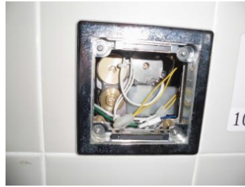
部品取外し内部清掃