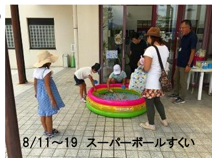
8/11~19 スーパーボールすくい