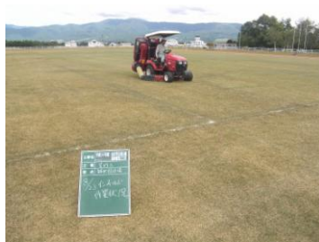
作業状況(補助競技場)