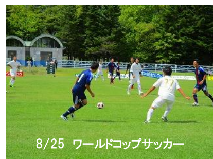
8/25 ワールドカップサッカー