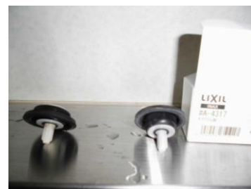
ダイヤフラムユニット取替