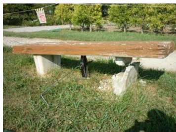
傾き修正、ジャッキアップ