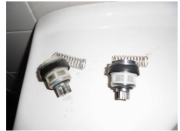
ピストンバルブ部取替え