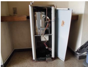
本体カバー取外し

体育館の冷水機が、水を飲むためレバーを作動した時に本体部分より水が漏れていた。本体カバーを取外し内部清掃後、外れていた接続部品を取り付け、締付金具を補強した。