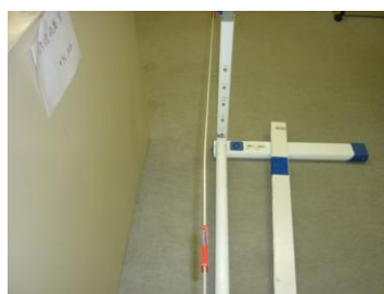
ガイドアルミバーの変形