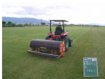
作業状況(芝生グラウンド)