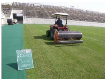
作業状況(総合球技場)