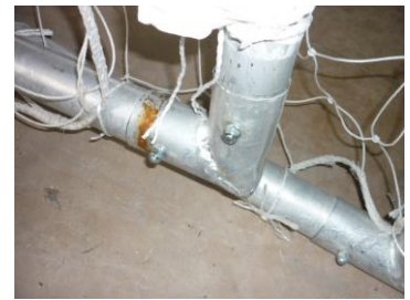
ゴール組立て完了