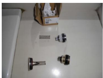
ピストンバルブ部交換部品