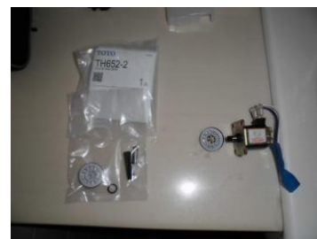
プランジャ部交換部品