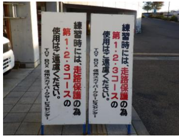
案内看板取付状況