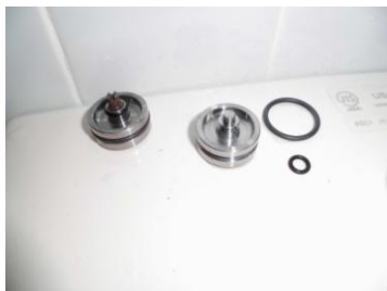
スペーサー・Oリング取替