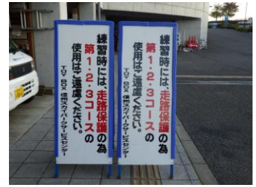
案内看板保護材取付