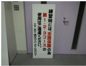
案内シール貼付け後