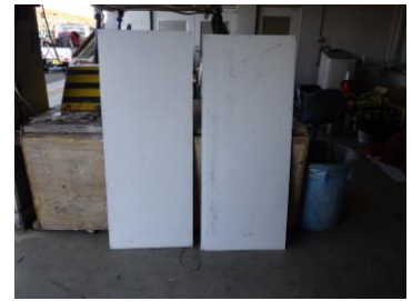
案内シール貼付け前