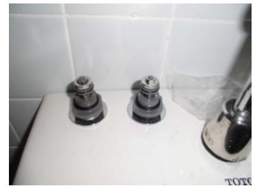
自閉バルブ部取替