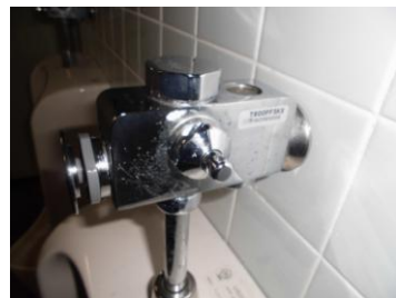
フラッシュバルブ取替完了