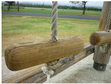
吊りロープ摩耗状況

アスレチック広場遊具の丸太とびのロープが摩耗した。22φのロープ2本の交換を行った。