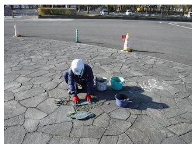
鉄平石貼りつけ作業