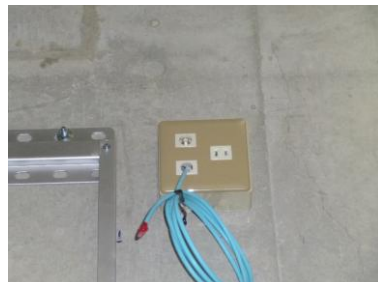
配線器具取付状況