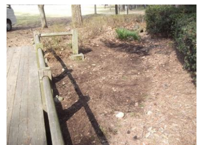
修景池流れ出口付近 清掃後