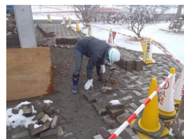
インターロッキング再利用設置状況