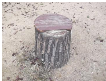
腰掛け天板の1枚脱落状況

大型木製遊具近くにある松の切り株を利用した腰掛けの天板の止めビスがルーズになり、天板が外れてしまった。ビスの止め穴に木栓を挿入し、切り株面にシール剤を塗布し、既存天板を再取付した。