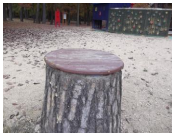
既存天板再取付完了