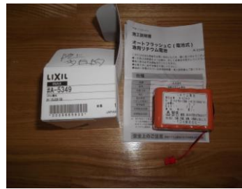
交換用内蔵リチウム電池