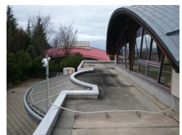
防犯カメラ移設後