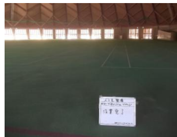
完了 グラウンド東面