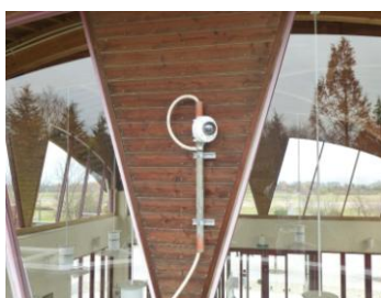
防犯カメラ移設前

以前の位置では南管理棟の屋根が映り4号駐車場が見えにくかった。防犯カメラを移設した。