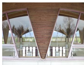
防犯カメラ撤去後