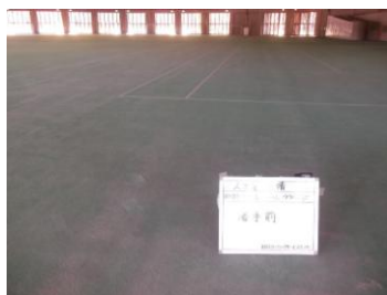
着手前 グラウンド東面