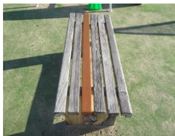
新規木板取替え完了