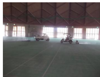
サッチャー及びブラシ掛け作業 状況