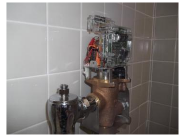
リチウム電池交換