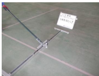
金属ゴミ等回収作業実施