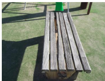
ベンチ天板破損状況

庭球場第5コートのコートサイドにある木製ベンチの天板中央部1枚が腐食し破損した。既存板を撤去し、新規にミツガ製 60mm×30mm×1,500mmの板材をガードラックで塗装し、取り付けた。