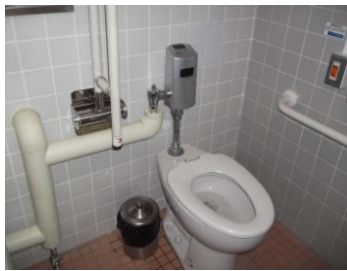
オートフラッシュ弁作動不良

陸上競技場 1F 東側多目的トイレの洋便器のオートフラッシュ弁が感知不能で洗浄水が自動的に流れなくなった。オートフラッシュ弁内蔵の専用リチウム電池 A-5349(LIXIL)が電圧低下(定格 3v→実測 2.47v)していた為、新品に交換。その後、正常に洗浄水が流れるようになった。