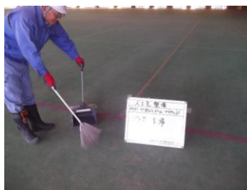
掃き清掃 グラウンド東面