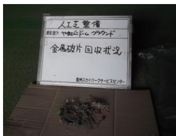
金属ゴミ等回収状況