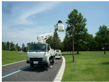
高所作業車による取替 2