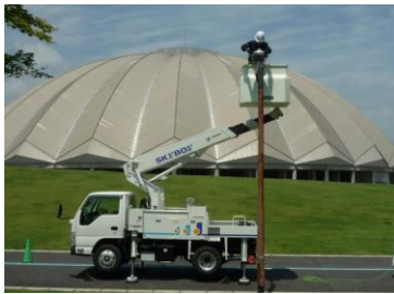
高所作業車による取替

ターミナルゾーンに設置されている外灯 400W 水銀灯は設置後 20 年以上経過しており器具の劣化による絶縁不良も発生している。今回はゾーン北側に対して交換作業を行った。メーカーでは水銀灯・安定器の製造を中止しているため、今後の維持費を考慮し、LED 電球に取替を行った。