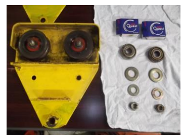
内部ベアリング更新