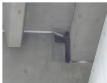
バックアップ材取付