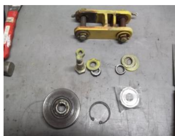
内部ベアリング分解