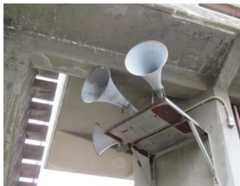
スピーカー取付状況