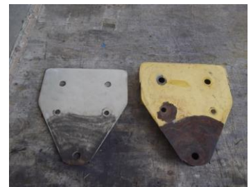
滑車表面カバー錆状況