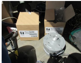
ドライバーユニット後継機