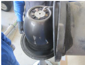
故障したドライバーユニット

陸上競技場のバックスタンドスピーカー2 基のドライバーユニットコイル部分が焼損していた。落雷による影響と思われる。故障したスピーカードライバーユニットは古く、現在生産されていないため、後継機に交換した。正常に吹鳴するようになった。