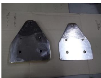
滑車表面カバー下地ケレン