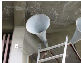
スピーカー取付状況 2