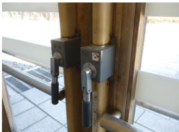
外扉ギヤーボックス不良

ギヤーボックス作動不良で、やまびこドーム大扉が開けなくなった。外側の扉は、ギヤーボックスを修理。内側のギヤーボックスは、オーバーホール品と交換した。