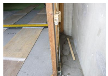
内扉ギヤーボックス不良