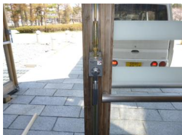
ギヤーボックス取り外し