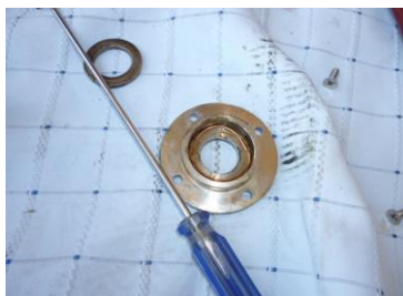
スペーサーの挿入