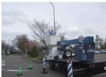
高所作業状況 外灯交換

園路各所の外灯が消灯していた。また、ターミナルゾーンでは風力発電用プロペラが割れていたため、その交換も行った。高所作業車を用いて電灯とプロペラを交換した。