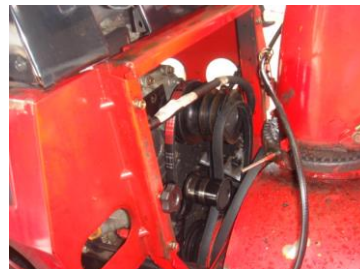
オーガ駆動ベルト破断状況