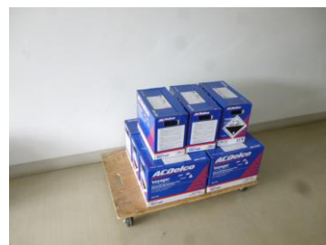
新バッテリー保管状況