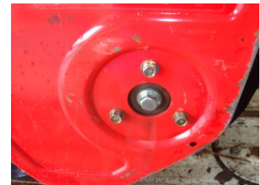
オーガ右シャフト ベアリング固定状態