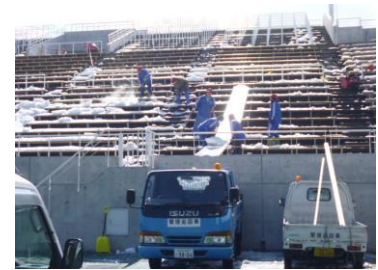
シューターによる除雪