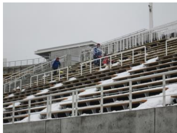
ロータリーによる除雪