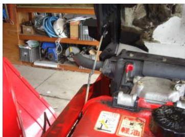
ボンネット変形と ステー棒溶接修理状況