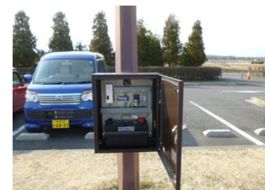
6号駐車場交換作業状況