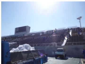
トラックによる搬出