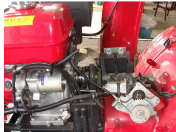
走行 V ベルトの位置