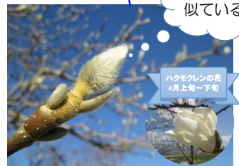
ハクモクレンの花 4月上旬～下旬