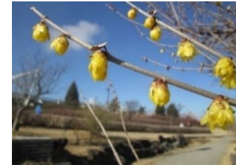
ロウバイ 1月上旬～2月下旬ごろ