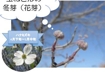
ハナミズキ 4月下旬～5月中旬