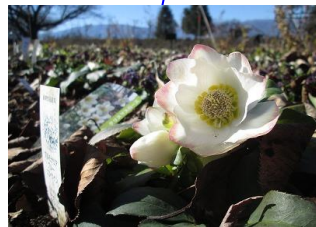
クリスマスローズ （早咲き種） 咲き始め：12月末ごろ