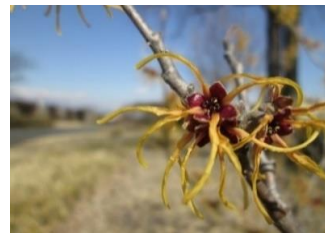
マンサク 2月上旬～3月中旬ごろ