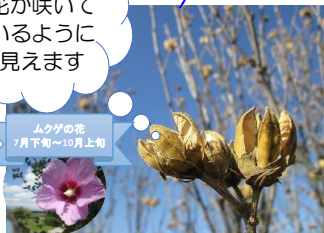
ムクゲの花 7月下旬～10月上旬